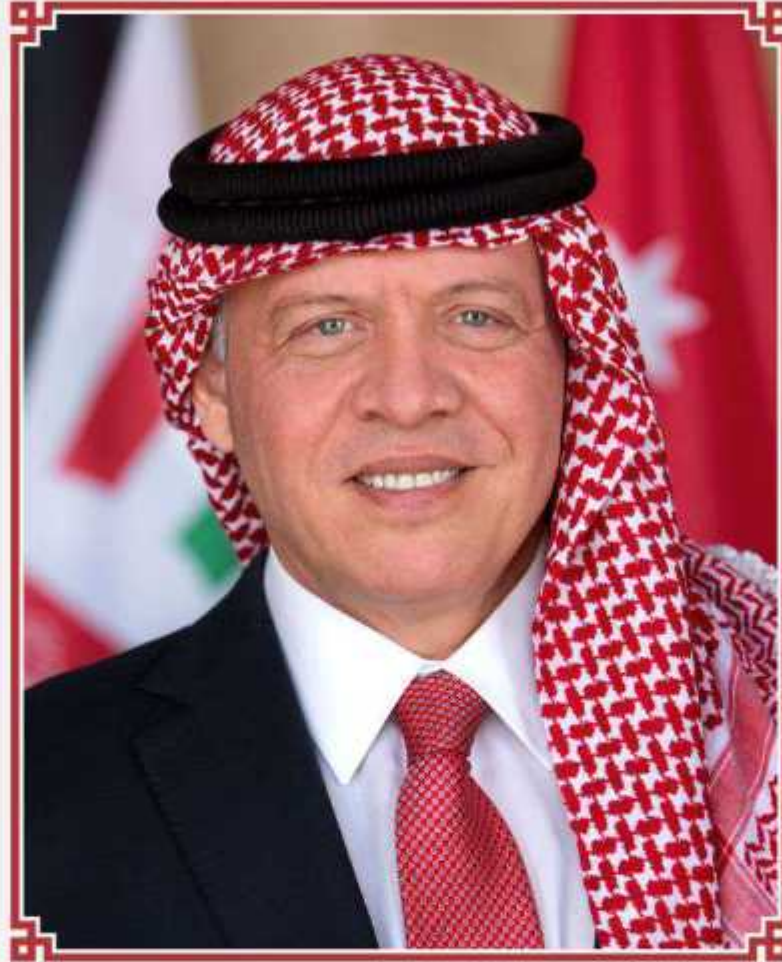
حضرة صاحب الجلالة الهاشمية الملك عبد الله الثاني ابن الحسين المعظم