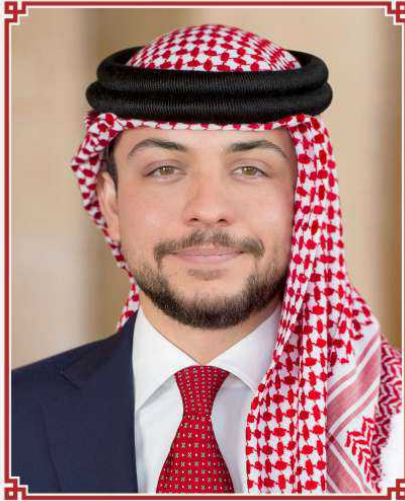
حضرة صاحب السمو الملكي الحسين بن عبد الله التميمي ولي العهد المعظم